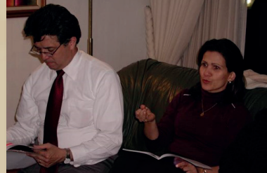
Acompañantes del primer +Pareja

Simultáneamente, se fueron consultando los fundamentos con diferentes consiliarios y matrimonios de los equipos, haciendo los ajustes correspondientes.